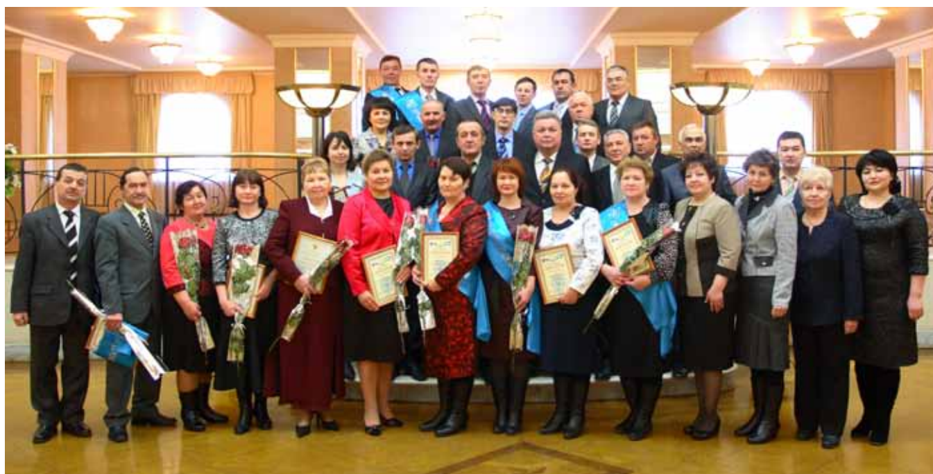
Победители республиканских конкурсов «Лучший по профессии 2011 года», «Лучшее ветеринарное учреждение 2011 года»