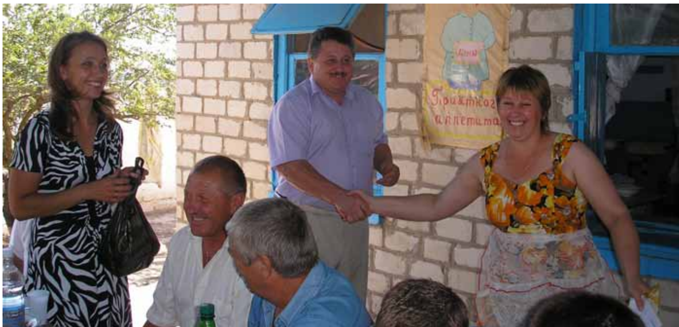
Премирование бригады поваров в СПК «Архангельский» по итогам жатвы 2011 года

НА СОВРЕМЕННОМ ЭТАПЕ РАЗВИТИЯ ОБЩЕСТВА КОЛЛЕКТИВНЫЕ ДОГОВОРЫ ПРИОБРЕТАЮТ ВСЕ БОЛЬШУЮ ЗНАЧИМОСТЬ В ПОВЫШЕНИИ СОЦИАЛЬНОГО УРОВНЯ ТРУЖЕНИКОВ. БУДЕННОВСКАЯ РАЙОННАЯ ОРГАНИЗАЦИЯ ПРОФСОЮЗА РАБОТНИКОВ АПК РФ (СТАВРОПОЛЬСКИЙ КРАЙ) УДЕЛЯЕТ ПОСТОЯННОЕ ВНИМАНИЕ УЛУЧШЕНИЮ СОЦИАЛЬНОГО ПОЛОЖЕНИЯ РАБОТАЮЩИХ В ОТРАСЛЯХ АПК, В ТОМ ЧИСЛЕ И СЕЛЬСКИХ ТРУЖЕНИЦ.